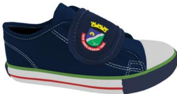
Vista externa (Foto Ilustrativa)

10- SOLA Peça integrante da base inferior do calçado. Deverá ser fabricado em borracha de butadieno estireno (SBR) vulcanizada. Este solado deve ser na cor preto, devendo ter a gravação da numeração em todos os tamanhos de forma permanente, e formato antiderrapante, similar a ilustração abaixo. E na sua base deve acompanhar o perfil da forma e ser em formato de cunha.