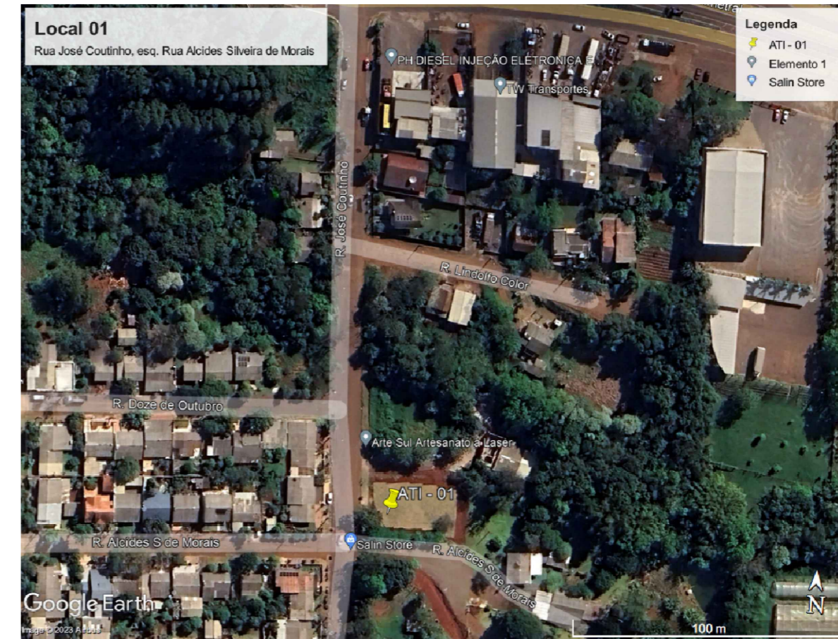
Situação - Google Earth