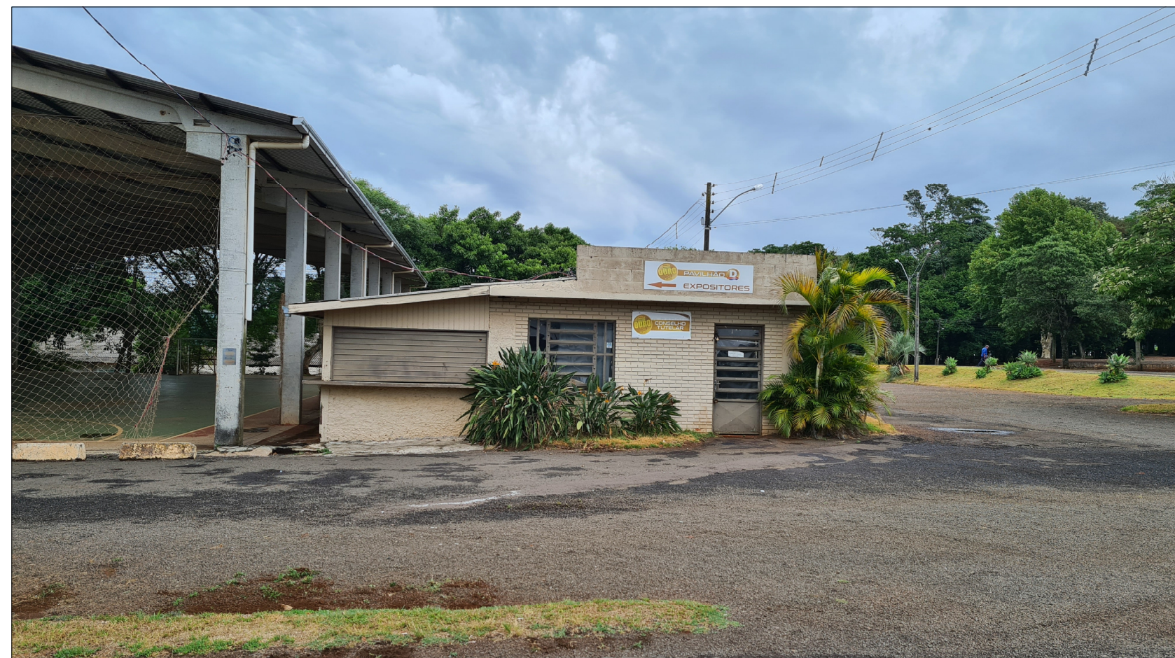
Foto 01 - Vista Frontal