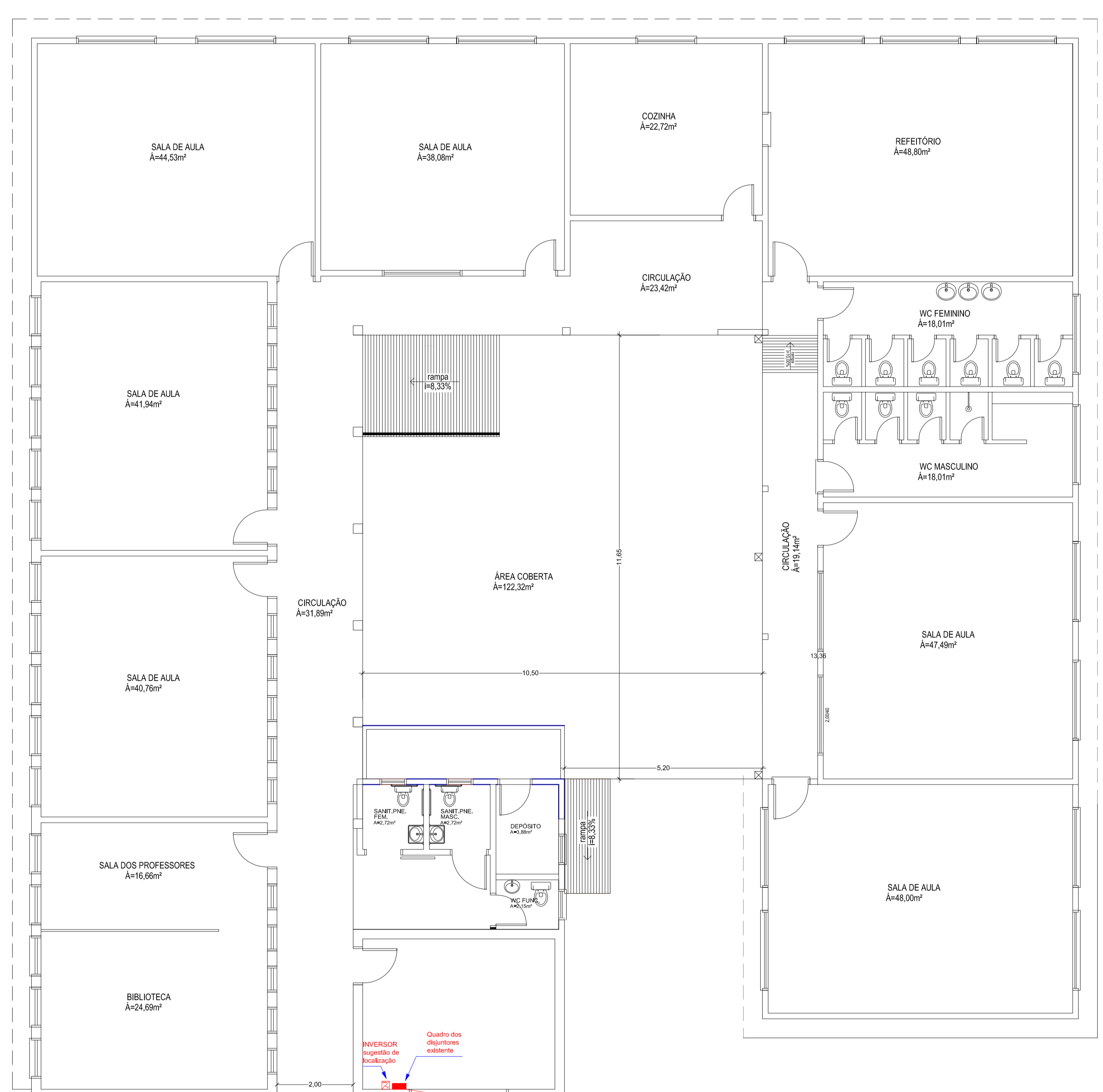
PL. BAIXA Exist. A=763,02 m 2